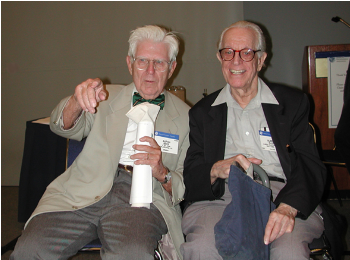
Aaron T. Beck si Albert Ellis, fondatorii teoriei cognitiv-comportamentale.